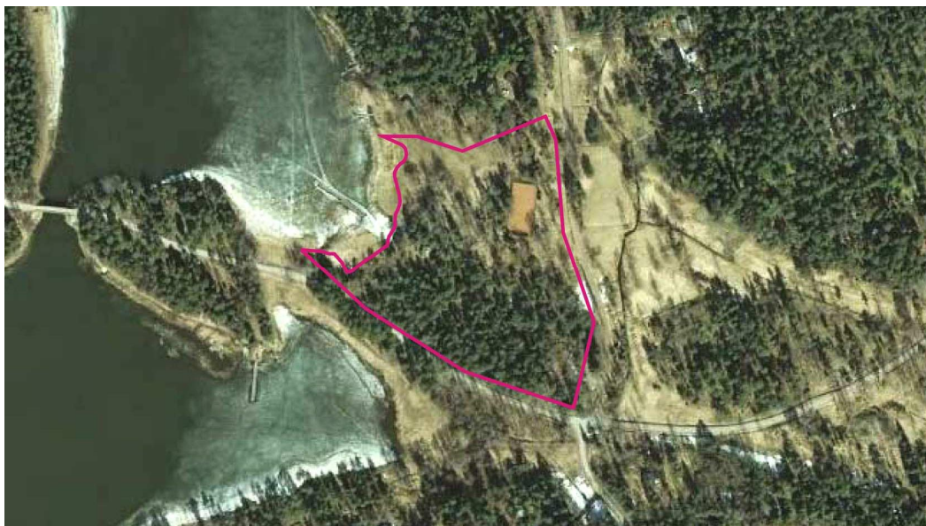
Flygbild. Planeringsområdet markerat med röd linje.

Områdets naturförhållanden är med tanke på områdets placering typiska. På området uppgörs en naturinventering (Silvestris Oy)