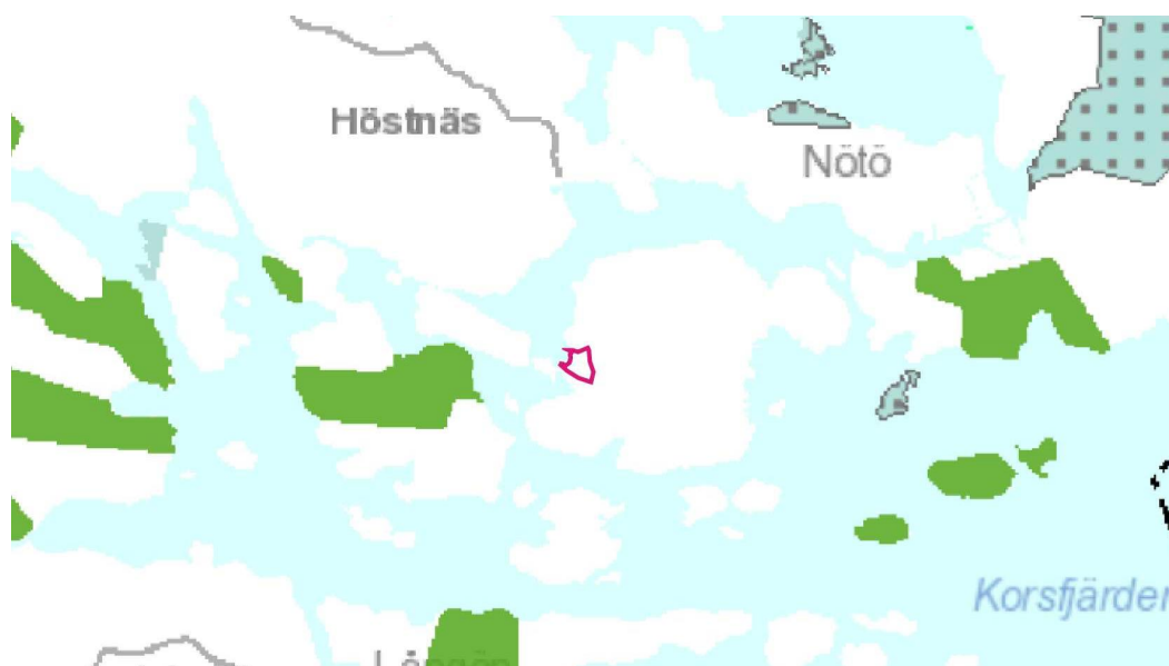
Utdrag ur sammanställning av de fastställda landskapsplanerna 2014, etapplandskap 1-3. Planeringsområdet markerat med röd linje

Raseborg hör till Nylands förbunds verkningsområde. Nylands landskapsfullmäktige godkände Nylands landskapsplan 14.12.2004. Miljöministeriet fastställde Nylands landskapsplan 8.11.2006. Nylands etapplandskapsplan 1 har godkänts 17.12.2008. Nylands etapplandskapsplan 2 har godkänts 20.3.2013. Nylands etapplandskapsplan 3 har godkänts 14.12.2011. I landskapsplanen har planområdet inte getts beteckningar.