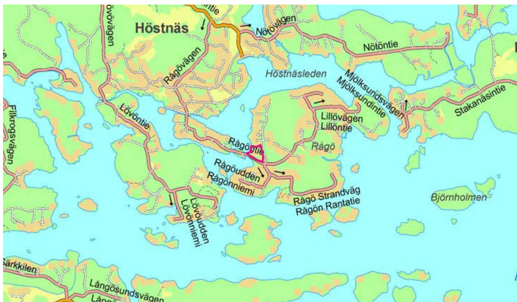
Planeringsområdet markerat med röd linje

Planområdet är beläget i Ekenäs skärgård på Rågös västra strand. Området omfattas av fastighet RN:r 4:81 (710-443-4-81) samt del av fastighet 4:137 (710-443-4-137) i Rågö by. Områdets areal är ca 2,1 ha.