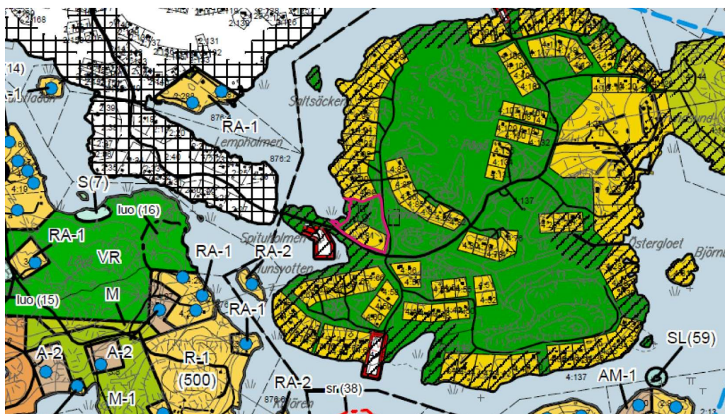
Utdrag ur östra skärgårdens generalplan. Planeringsområdet markerat med röd linje

Området har i Ekenäs östra skärgårds delgeneralplan noterats som område med gällande stranddetaljplan.